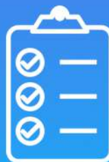
Lista de tareas